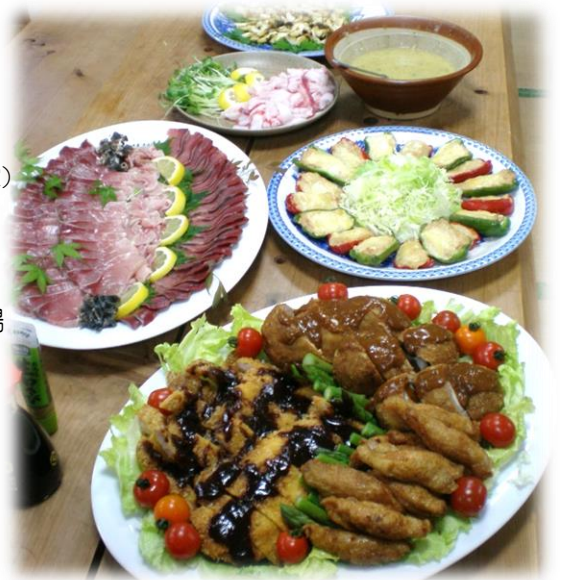
小値賀の海の幸・山の幸もたっぷりご堪能下さい！